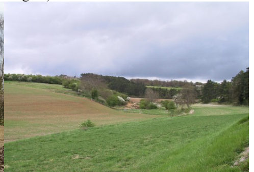
Le vallon vers la Croix Saint-Leufroy