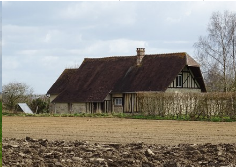
Une maison à pans de bois et toiture haute