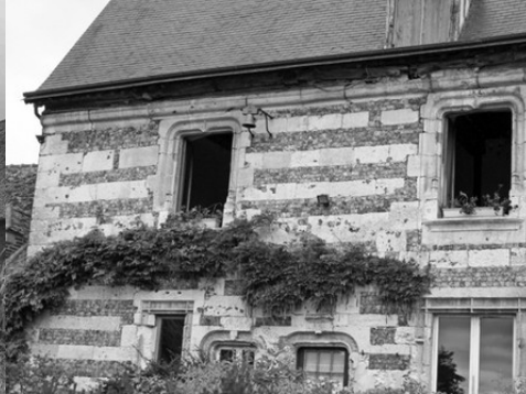
Les ancienne baies (vue proche)