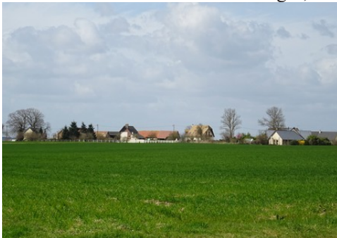
Le hameau de la Boissaye vu des champs

Les avis seront cohérents avec ceux émis ces dernières années, à savoir : pas de maisons à volume compliqué (type V, W, Y, ou Z), pentes à 45° pour les volumes principaux, ardoise ou tuile plate de teinte brun vieilli, à 20u/m 2 , avec un débord de toiture de 20cm, enduit de teinte beige clair avec modénatures (au choix : chaînages, encadrement de fenêtres, soubassement, colombage...). *Voir les autres fiches.