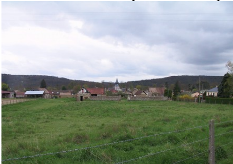
Le village de la Croix Saint-Leufroy