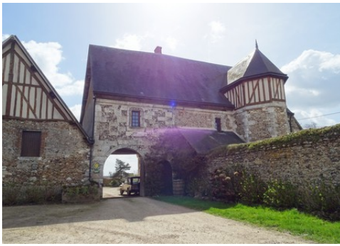
La façade nord et l'entrée du manoir