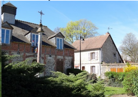
Le recours à la briques et aux moellons