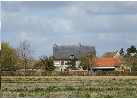
La façade sud vue des champs