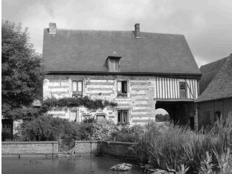
La façade sud du manoir, sur cour