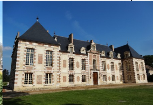
Le château de la Croix Saint-Leufroy