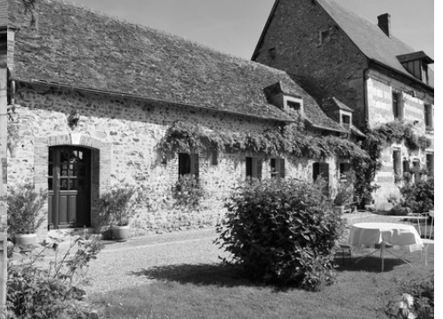
Les dépendances attenantes

Pour la zone en rose foncé dans le périmètre de 500m