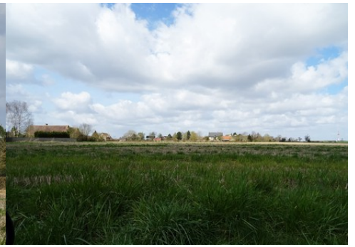
Une vue lointaine depuis la RD10